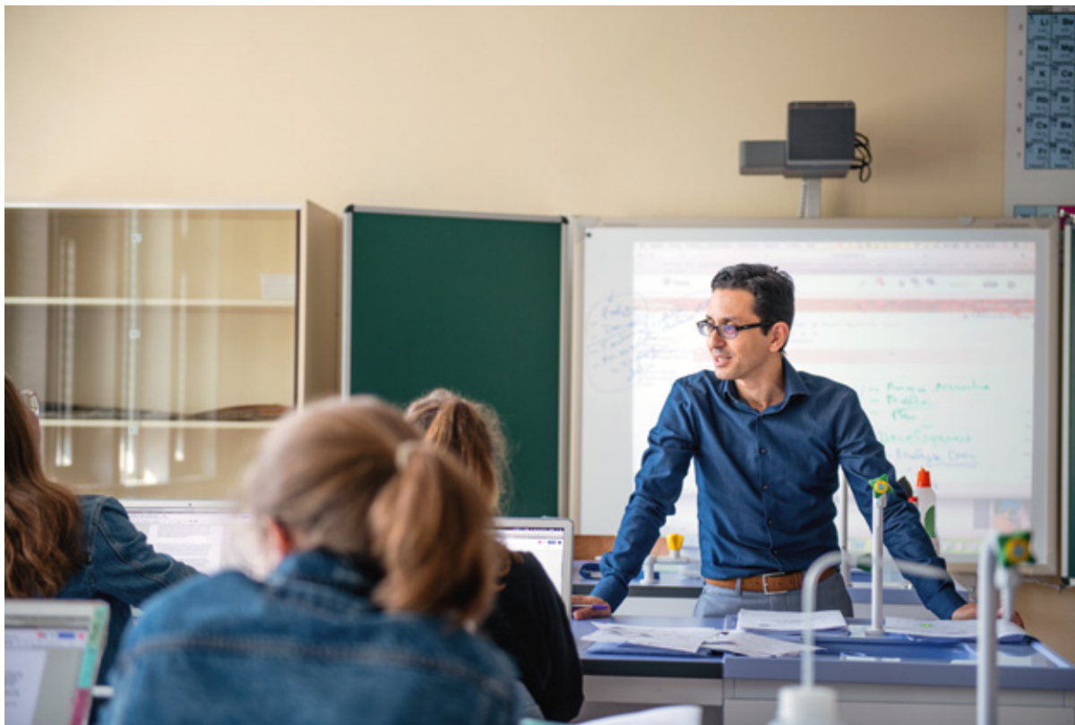
Florimont met un accent fort sur les langues étrangères et les matières scientifiques.