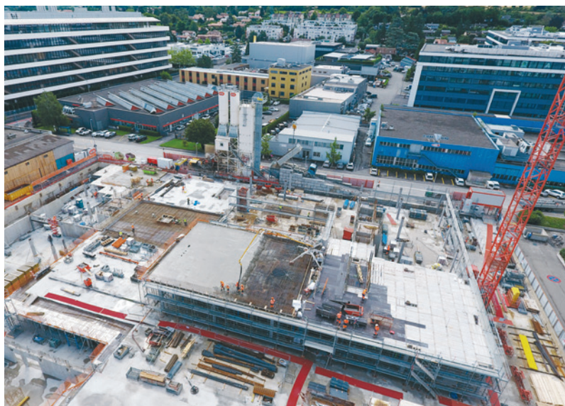
Le chantier du projet Spark à Plan-les-Ouates.

Au 31 décembre 2020, l'immobilier direct de la CIEPP représentait environ 7,25% de sa fortune pour un montant de plus de 589 millions de francs. L'objectif stratégique se situe à 12% de la fortune. Compte tenu, notamment, des projets de construction en cours, la CIEPP devrait atteindre son objectif stratégique au