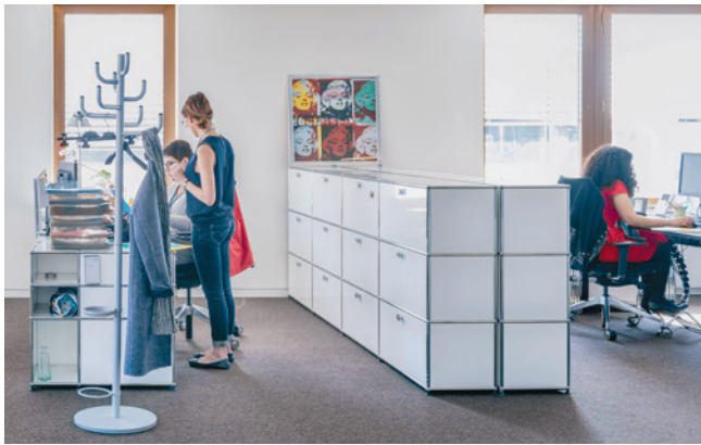
Le service du Conseil à la clientèle.