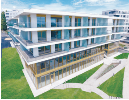
L'immeuble locatif du chemin des Saules à Nyon.

cours des cinq prochaines années, ce qui représentera plus de 1,3 milliard de francs d'investissements. Le portefeuille immobilier de la CIEPP est très majoritairement constitué d'immobilier résidentiel, situé essentiellement dans les régions romandes de Genève, Vaud, Fribourg et Neuchâtel.