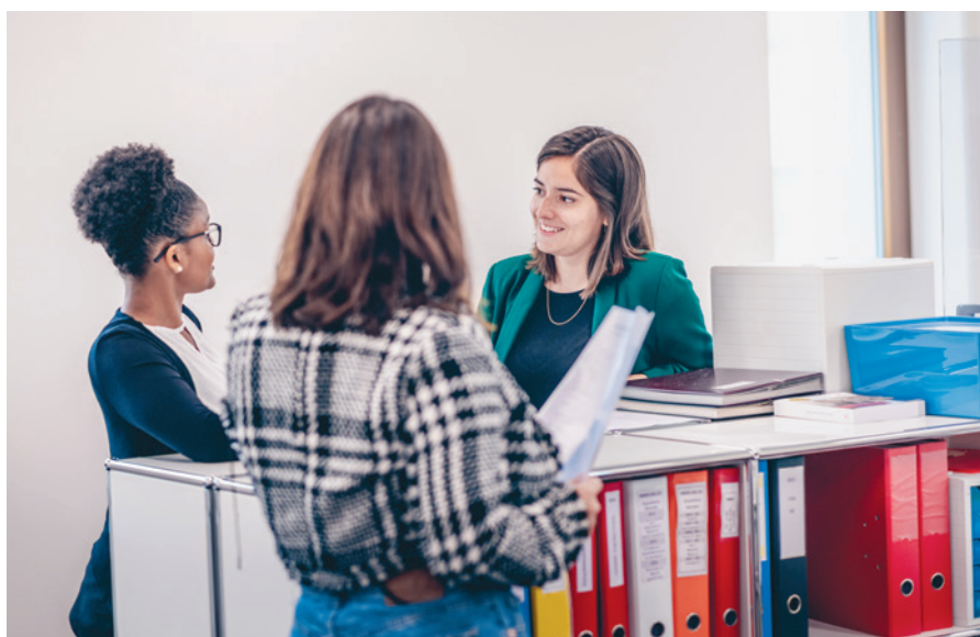
Le service comptabilité.

La CIEPP compte plus de 70 collaborateurs, répartis entre son siège de Genève et ses agences régionales de Bulle, Fribourg, Porrentruy et Neuchâtel. La moyenne d'âge est d'environ 43 ans. L'effectif est fidèle, puisque la durée moyenne d'ancienneté malgré la croissance de l'effectif