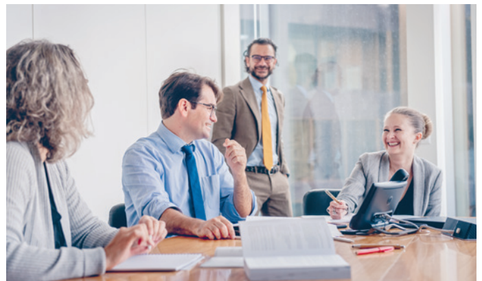
Une séance de différents cadres.

confiance de la part de ses affiliés et assurés. Les collaborateurs saluent la grande capacité de la caisse d'avoir su garder le cap pendant des tempêtes comme celle de la crise financière de 2008. Cette longévité montre à leurs yeux que la CIEPP répond à un réel besoin dont la confiance de ses affiliés, assurés et pensionnés témoigne. Le fait d'avoir créé la CIEPP bien avant que la loi fédérale sur la prévoyance professionnelle ne voie le jour en 1985 est également source de fierté: « Nous avons été précurseurs » ou « Quelle clairvoyance ! » sont parmi les commentaires recueillis. Le 60 e anniversaire représente une date qui marque une belle réussite. Pour beaucoup de collaborateurs, cet anniversaire est l'occasion de partager une étape ensemble. Le modèle de la CIEPP est atypique, fondation commune indépendante, sans but lucratif, sans frais de marketing ni de publicité et qui ne rémunère aucun intermédiaire ni apporteur d'affaires, ce que soulignent plusieurs personnes en relevant sa persévérance à le maintenir dans un marché toujours plus concurrentiel. De nombreux collaborateurs se réjouissent des années à venir et souhaitent à la CIEPP « un magnifique futur ! »