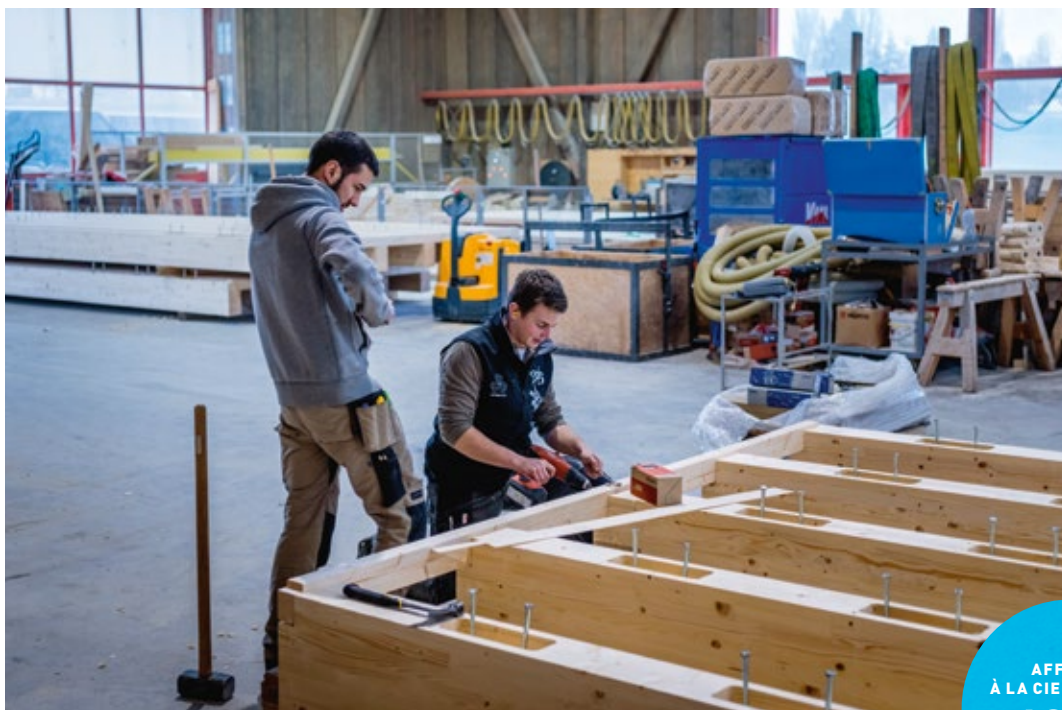
Les équipes Vial assurent la préparation, et sur les chantiers, montage et finition.